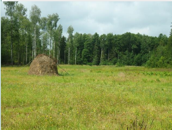
8,7 ha poletek żerowych

Wykonano dwa nowe i poprawiono dwa istniejące wodopoje.