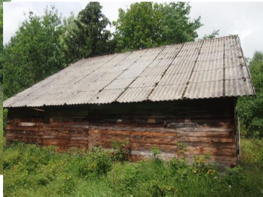
Modernizacja „starej” stodoły